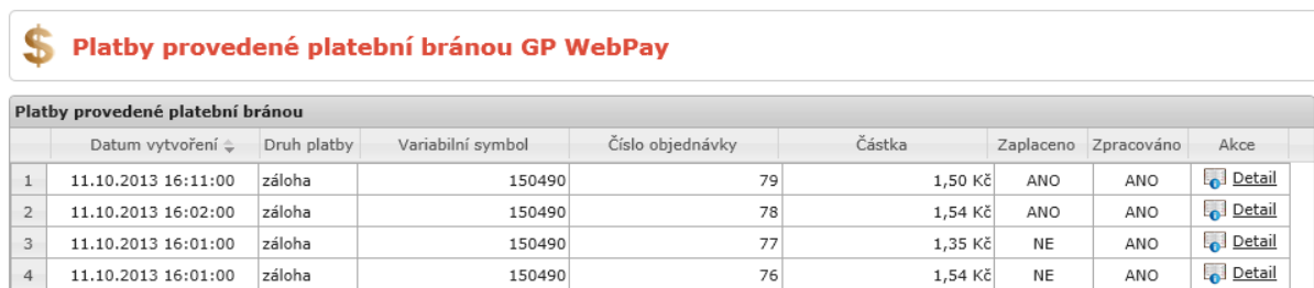
Obrázek 6 - Přehled realizovaných plateb

Pro zobrazení všech vašich plateb klikněte v horním menu na Platby a potom na On-line platby .